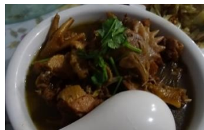
Smagslagene bliver udfordret (privat)

"Alle deltagere har haft en fantastisk tur til Kina. Vores værter var helt utroligt gæstfrie, og viste fantastiske og originale sider af Kina. Det kinesiske folk har mødt deltagerne med stor venlighed, interesse og hjælpsomhed. Mange fik smagt mad som fx insekter og dele af dyrekroppe, som normalt aldrig spises i