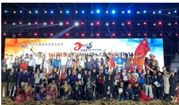
Fællesbillede af deltagerne i "2018 International Equestrian Festival" (privat)

Deltagerne fra de forskellige lande var inviteret til hestefestivalen i Kina for at hjælpe kineserne med at sætte fokus på TREC og hjælpe dem godt i gang med disciplinen. De kinesiske TREC-ryttere og TREC-dommere havde naturligvis en begrænset erfaring med TREC, så de internationale TREC-ryttere viste, hvordan TREC kan/skal rides. Formændene og de øvrige internationale deltagere, der ikke deltog som ryttere, er næsten alle internationale eller nationale TREC-dommere. De dømte den internationale klasse sammen med kinesiske dommerkolleger, så de kunne få mest mulig erfaring.