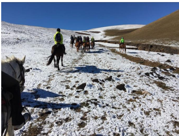
40 km ridetur ved grænsen til Mongoliet (privat)