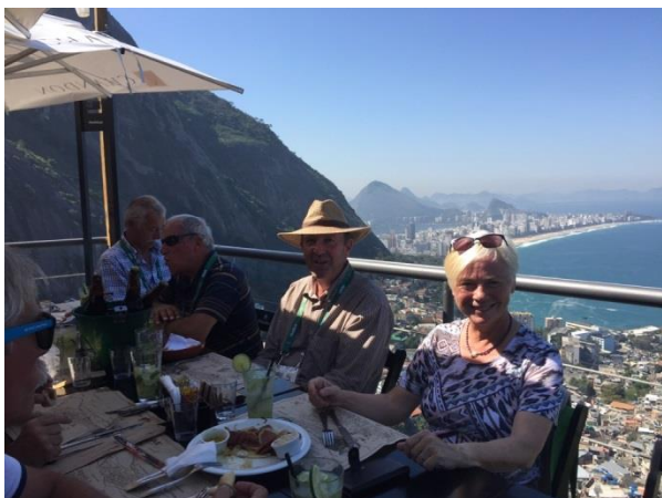
Middag med udsigt

"Trist fordi der er så stor forskel på rig og fattig. Den store kriminalitet og ikke mindst manglen på respekt for menneskeliv. Vi spiste eksempelvis frokost i en Favela (fattigt kvarter red.), og her blev der betalt beskyttelsespenge til de lokale 'bosser', så vi kunne være i fred. Det fantastiske af Brasilien var naturen. Vi var på en sejltur den ene dag, og det var nærmest som at tage et smut til paradys. Flot natur, skønhed og stilhed. Det var fantastisk."