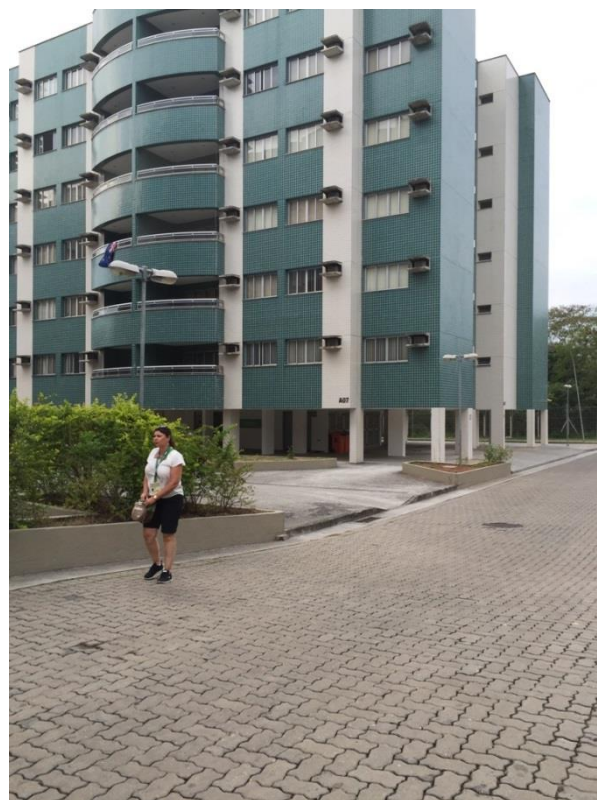
Her boede dommerne under OL

glæde, når man så endelig skal afsted. Men det største må være at opleve hele den olympiske atmosfære, og det setup et OL kræver. Og sådan helt personligt så er det meget stort at være udpeget til at dømme verdens bedste ryttere."