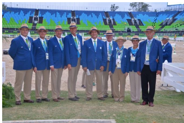
Dommerteamet Rio 2016

40.000 enkeltkarakterer ved dette OL, og der blev kun rettet 30 karakterer, så det må være godkendt."