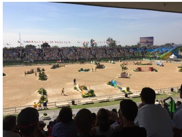
Det flotte stadion i Rio

bakkede hinanden op og støttede hinanden alle dagene."