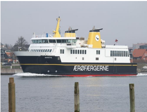
Ærøfærgeren der sørger for transport mellem ø og fastland.

"på den anden side", som man kalder det her på Ærø. Vi mangler fortsat et kvalifikationsstævne og håber på også at nå blandt de 15 bedste, der går videre til finalen. Derfor regner vi også med at skulle med færgeren frem og tilbage mindst 3-4 gange mere her i løbet af efteråret 2016.