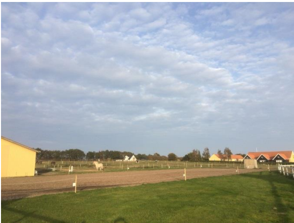
Ærø Rideklub udefra