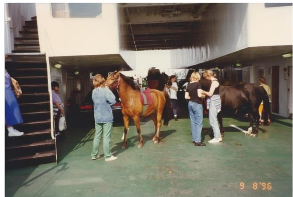
Hestene på færgen til fastlandet

le sådan over på fastlandet med færgen, så var det ikke med trailer, for det havde man jo ikke. Vi trak bare hestene ombord, og så stod de løst på dækket. Det kunne være lidt svært for dem at stå fast, hvis de havde sko på, men det løste vi ved at sætte bilslange uden på hovene. Det var aldrig et problem at have hestene med på færgen på den måde, og når vi kom over på den anden side, holdt der en vognmand klar til at køre hestene videre.”