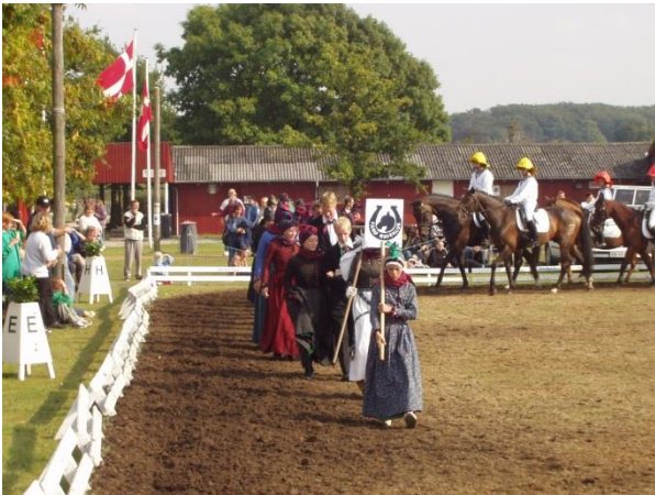
Landsfinalerne i Odense 2003

I dag er Fanø Rideklub meget engageret i Landsfinalerne, og hvert år tropper ø-klubben op med mange frivillige, der er med til at skabe en fantastisk weekend for alle deltagere.