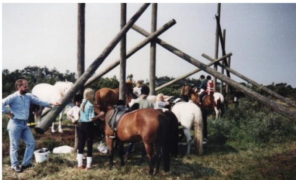
Ridelejr på Fenjagården

Rideklubben blev stiftet tilbage i 1974 og kunne altså i 2014 fejre sit 40 års jubilæum. Til at begynde med kostede det 5 kr. om mdr. at være medlem af klubben, og ingen i bestyrelsen anede, at man eksempelvis kunne få tilskud fra kommunen. Det fandt de heldigvis ud af, da der kom nye medlemmer i klubben, der vidste lidt mere om gængs klubdrift. I mange år havde klubben hjemme på en privat gård, men sidst i 80'erne købte klubben ejendommen, og der blev bygget ridehal. Først herefter blev der lavet egentlige elevhold. I starten foregik det på ponyer, som klubben lejede, men i 90'erne blev der endelig købt egne heste ind til elevskolen. Det var også i 90'erne, at Fanø Rideklub blev medlem af Dansk Ride Forbund.