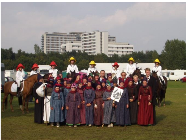
De flotte kostumer i kvadrillen