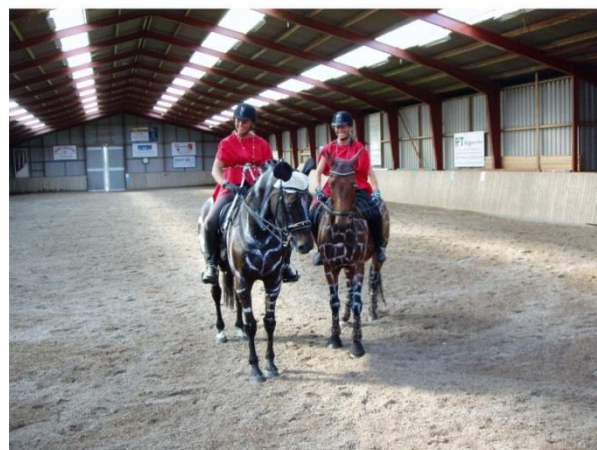
Der trænes Pas de Deux

meste kalender samt de mere gængse ting som dressur og spring. I Fanø Rideklub har man siden 2012 også givet sig i kast med voltigering, så også det er en mulighed på den jyske ø. Det er vigtigt for klubben, at der er plads til alle, og at familierne kan samles om oplevelserne med hesten. Derfor er der etableret det, der hedder børneridning, hvor mor og far kan være med om søndagen, når barnet får en træktur på banen eller i naturen. Med den store interesse for breddeaktiviteterne, og den helt særlige ø-ånd, er Fanø Rideklub et sted, hvor sammenhold og fællesskab er en stor del af det at have hest - i alle generationer.