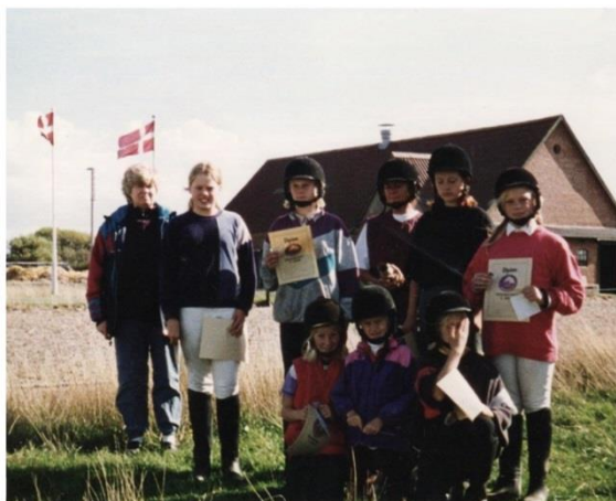
Ridemærkeprøve på Fanø

Rent økonomisk har klubben også nogle gode indtægtsmuligheder, der hjælper i klubkassen. Eksempelvis er der en hvert år en tysk drageklub, der lejer klubbens faciliteter, og det giver rundt regnet et beløb på 30.000 kr. Derudover hjælper klubben også til med rengøring efter Fanø Sommer Cup, og det giver ca. 10.000 kr. Når det kommer til at tiltrække nye ryttere, så afholder rideklubben hvert år et åbent hus med opvisning og bredde-aktiviteter, og her er alle velkommen.